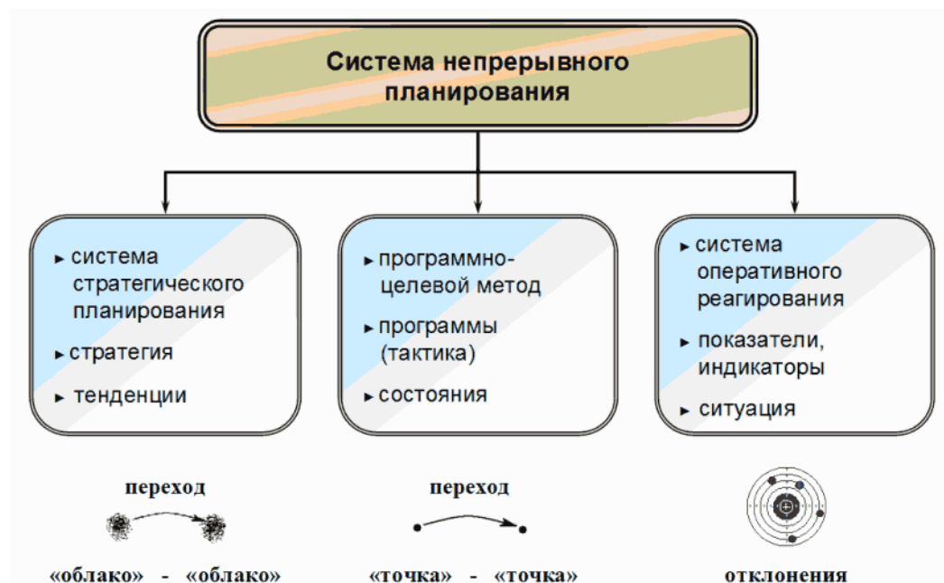
Рисунок 1. Схема непрерывного планирования

Вторым компонентом системы непрерывного планирования является использование программно-целевого метода управления развитием региона. Задачей использования программно-целевого метода является "переход из точки в точку", т.е. обеспечение достижения конкретных показателей и индикаторов социально-экономического развития региона путем реализации конкретных программных мероприятий. При этом Стратегия развития ни в коем случае не противопоставляется Плану мероприятий по социально-экономическому развитию. Развитие тенденций органически дополняется планированием реализации конкретных мероприятий.